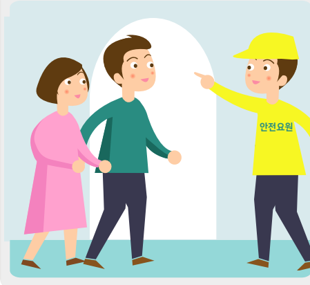
안전요원의 안내에 따라 이동통로와 출입문을 이용하여 질서를 지켜 입·퇴장합니다.