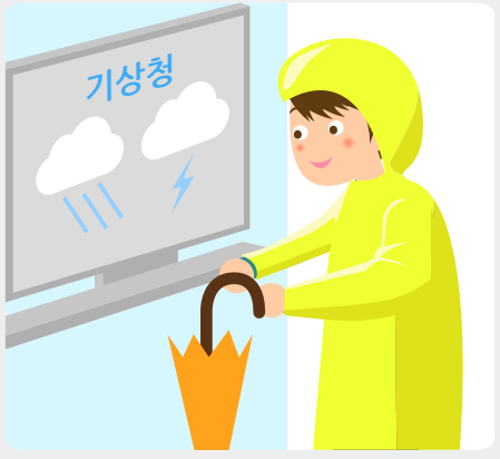
일기예보를 확인하고, 날씨에 맞는 복장과 물품을 준비합니다.