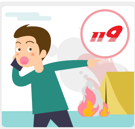
축제장에서 위험한 상황을 목격하면 주변의 안전 관리요원에게 알리고 119에 신고합니다.