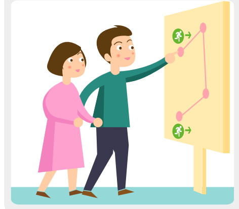
축제장 배치도를 알아두고, 긴급상황 발생에 대비하여 비상대피 통로를 확인해둡니다.