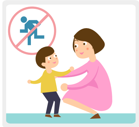
어린이들은 보호자와 함께 참여하고, 축제장 주변에서 뛰어다니거나 돌아다니지 않도록 교육합니다.