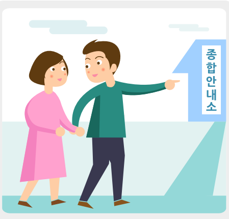
축제장에서 서로 헤어질 상황에 대비하여 종합안내소 등 만날 장소와 연락 방법을 정합니다.