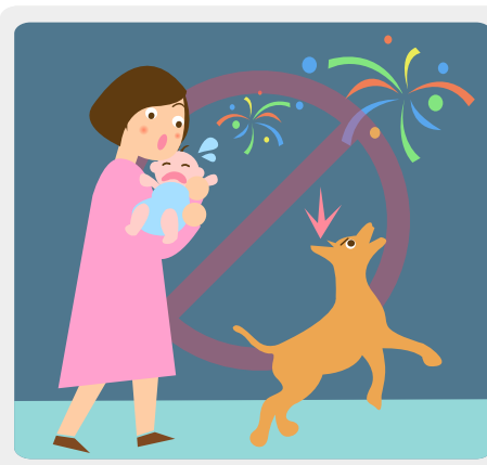
불꽃축제는 소음이 발생하기 때문에 갓난아기나 청각이 예민한 애완동물을 데리고 가지 않습니다.