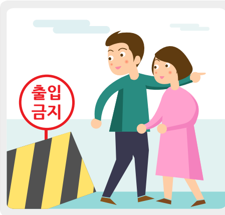
축제장 내 위험표지판, 안전선 등이 설치된 출입이 금지된 구역에는 들어가지 않습니다.