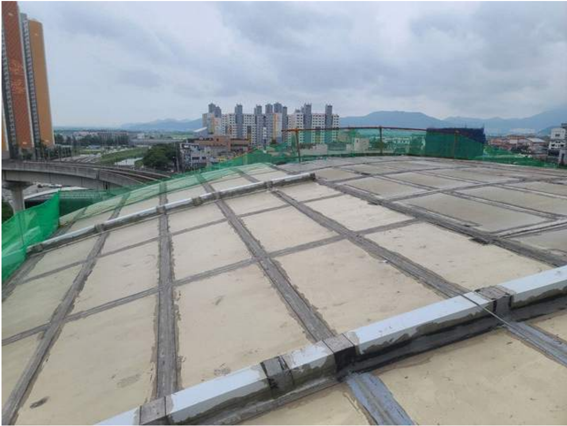
안전난간대 참고사진(작업자 안전 및 낙하물 방지목적) 2-1