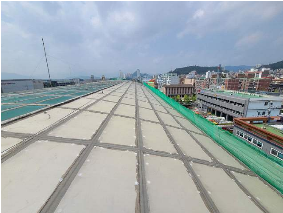
안전난간대 참고사진(작업자 안전 및 낙하물 방지목적) 1