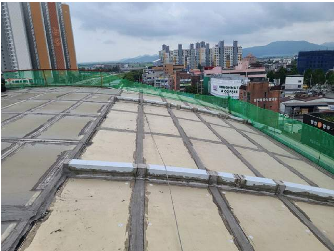
안전난간대 참고사진(작업자 안전 및 낙하물 방지목적) 2-2